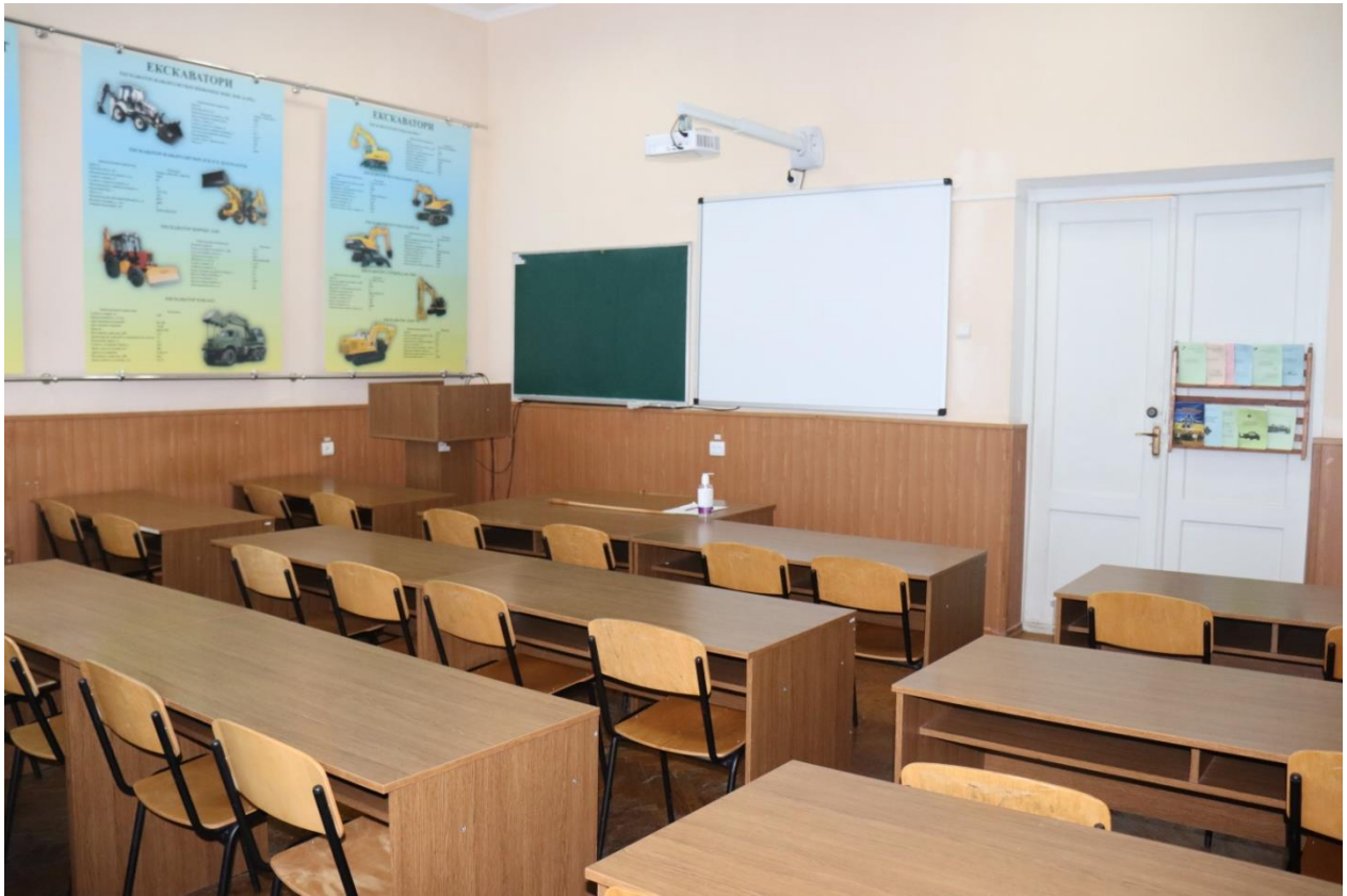
Навчальна аудиторія «Будівельно-відновлювальна техніка» №5119