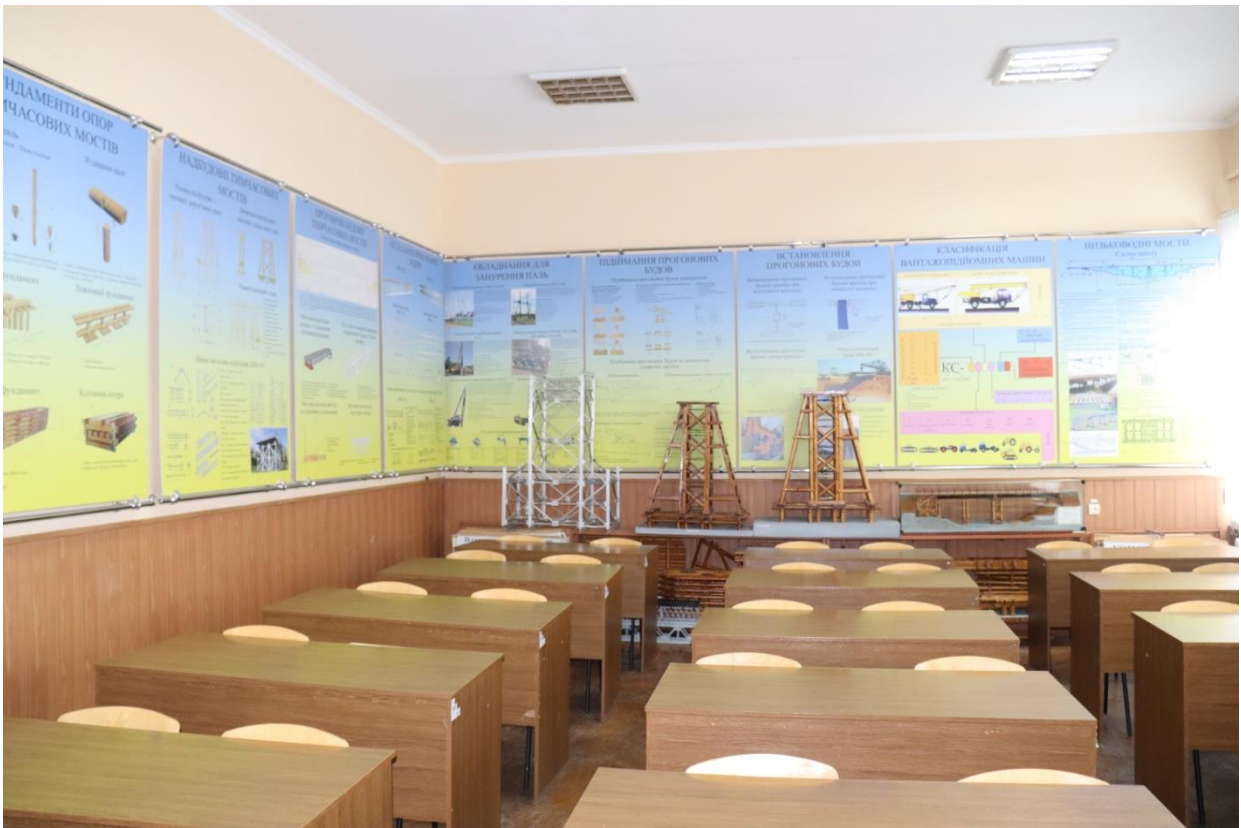
Навчальна аудиторія «Відновлення штучних споруд» №5108