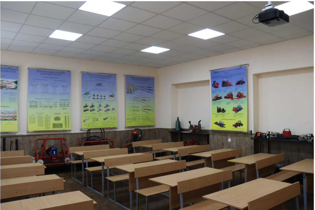
Навчальна аудиторія «Відновлення залізниць» №414