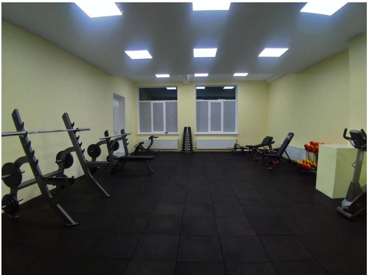
Зал атлетичної підготовки