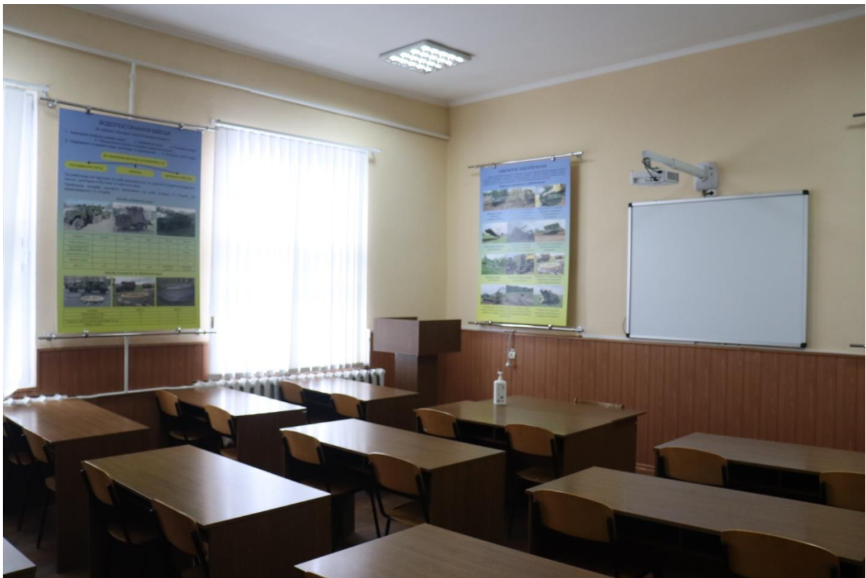
Навчальна аудиторія «Інженерної підготовки» №5110