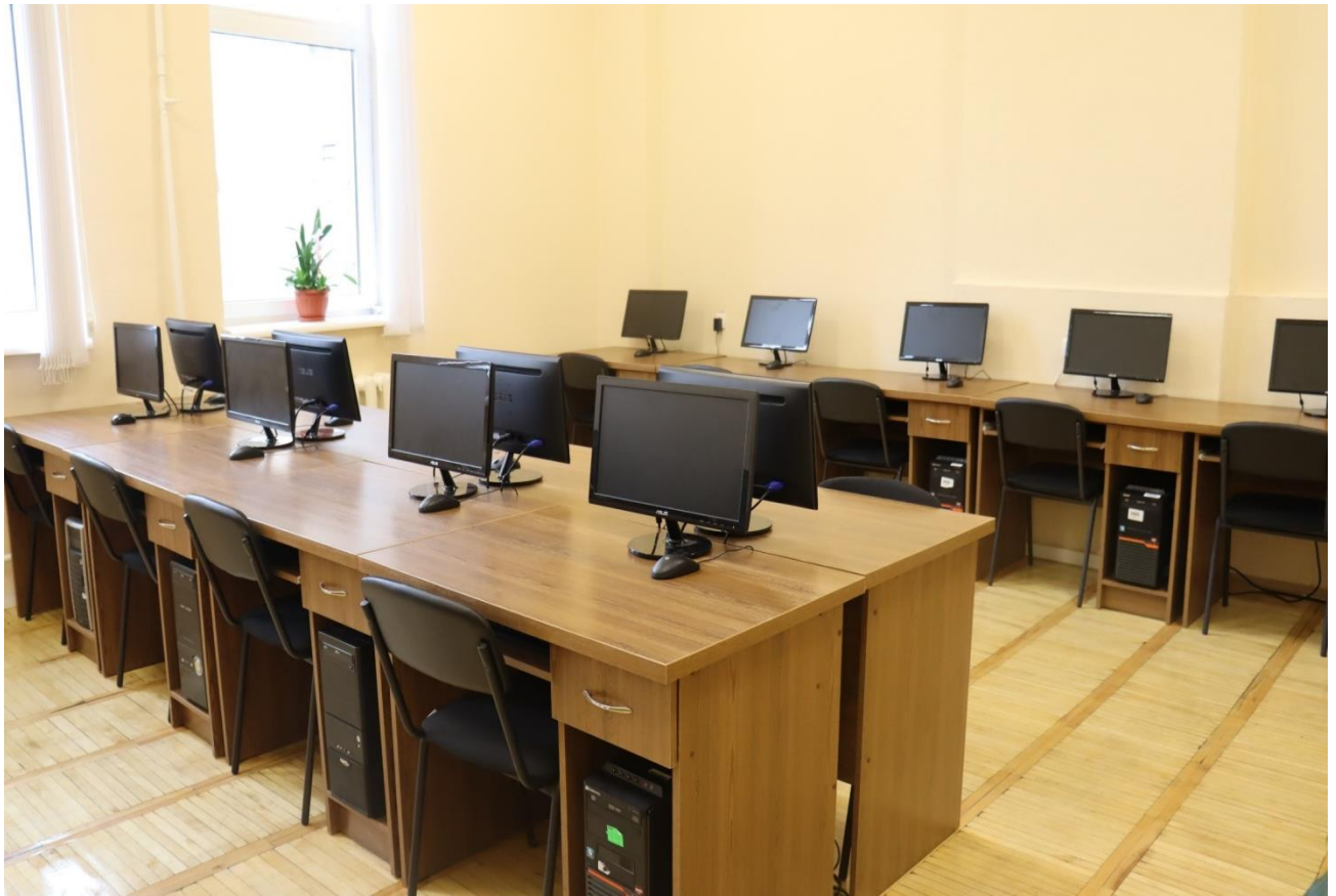
Лабораторія технічних засобів навчання аудиторія №535