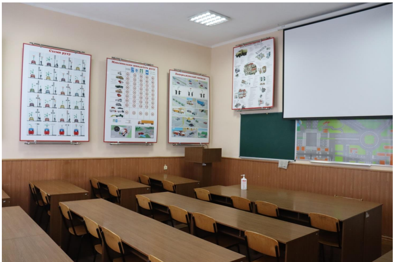
Навчальна аудиторія «Правила дорожнього руху» №5117