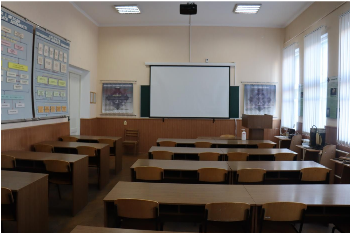
Навчальна аудиторія «Управління та зв'язку» №533