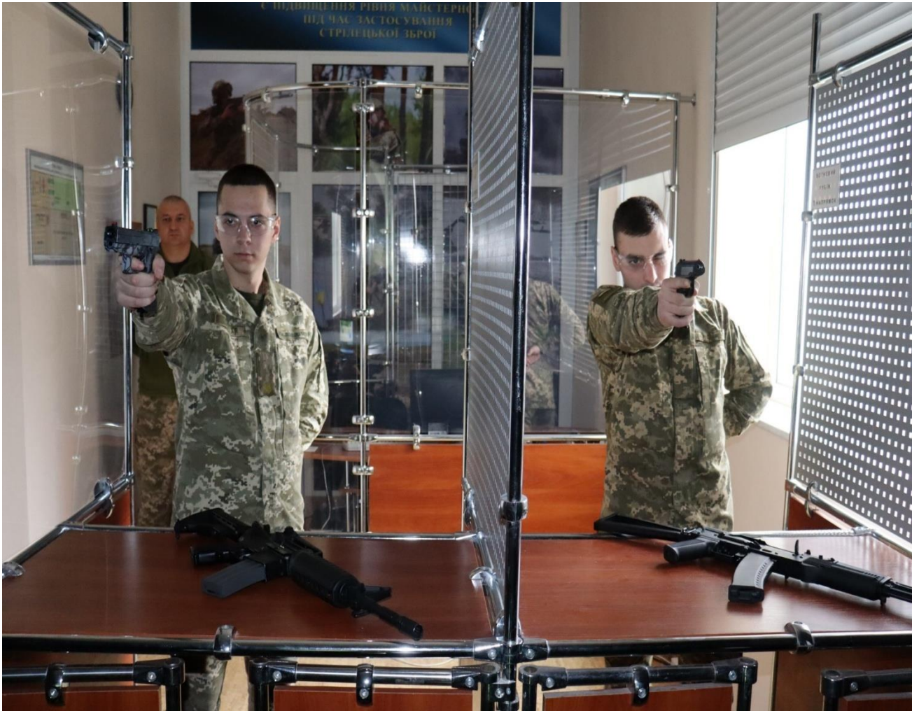
Електрифікований тир «ІНГУЛ»