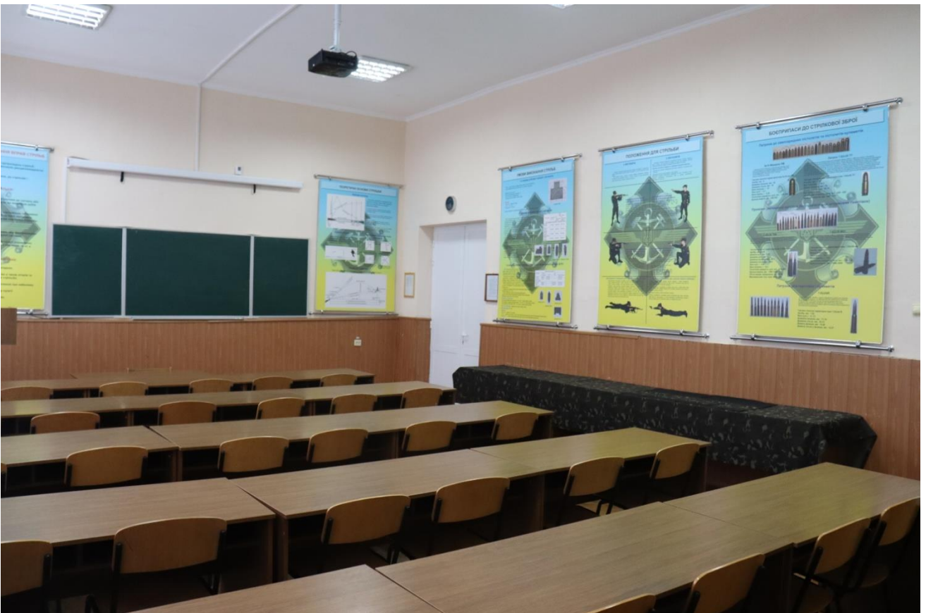
Навчально-тренувальний комплекс з вогневої підготовки аудиторія №531