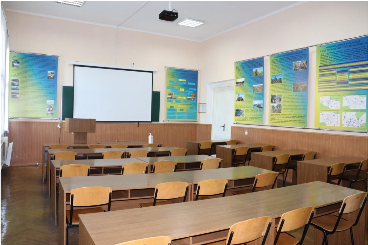
Навчальна аудиторія «Загальної тактики та захисту від ЗМУ» №534