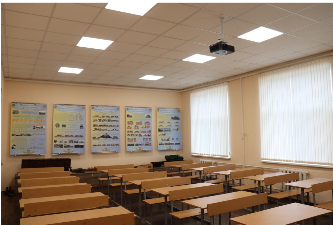
Навчальна аудиторія «Військових сполучень та перевезень» №411