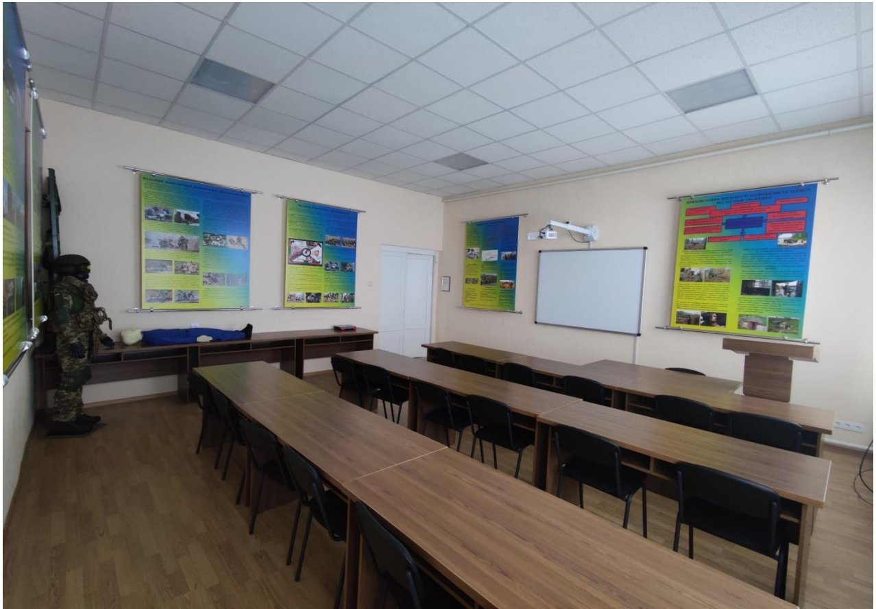
Навчальна аудиторія №5109 «Бойової системи виживання воїнів та тактичної медицини»