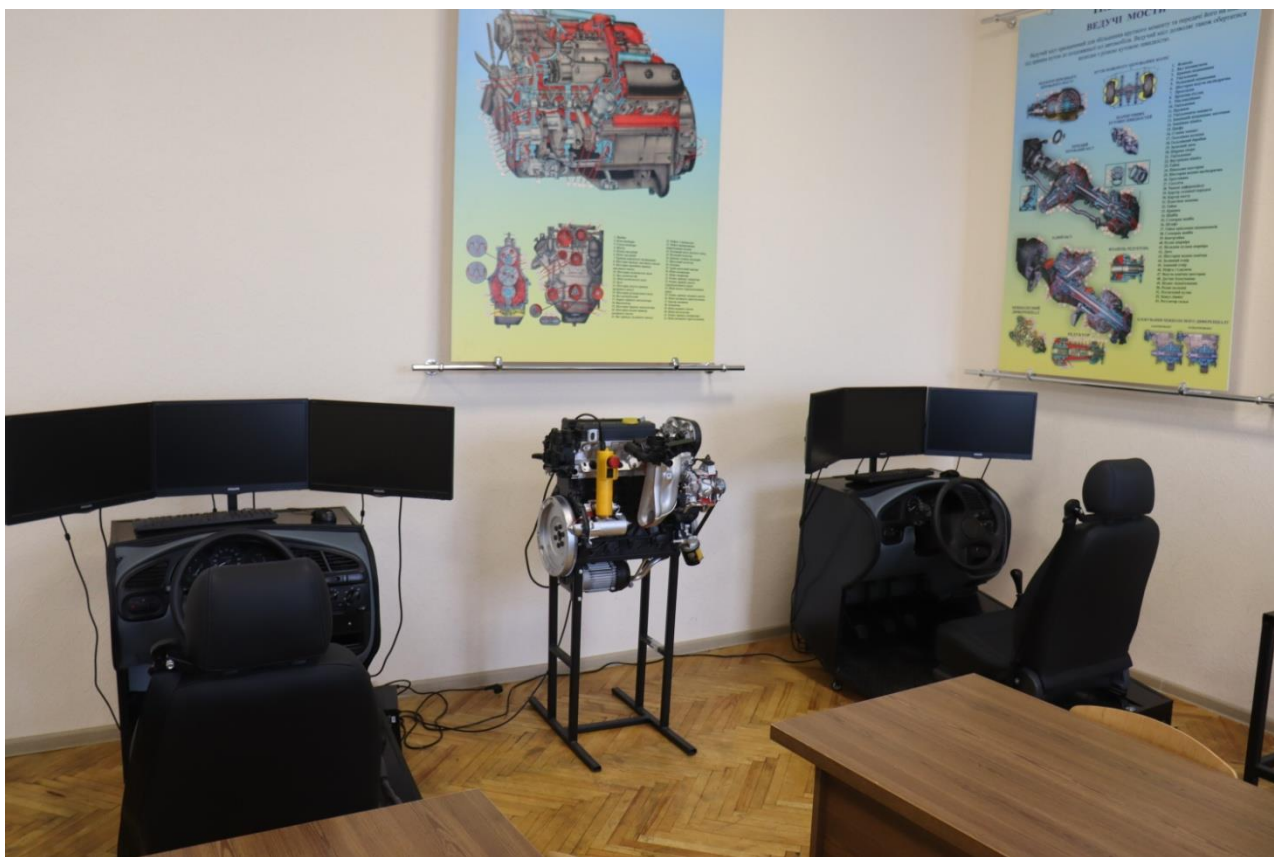
Навчальна аудиторія «Автомобільна підготовка та будова автомобіля» №5106