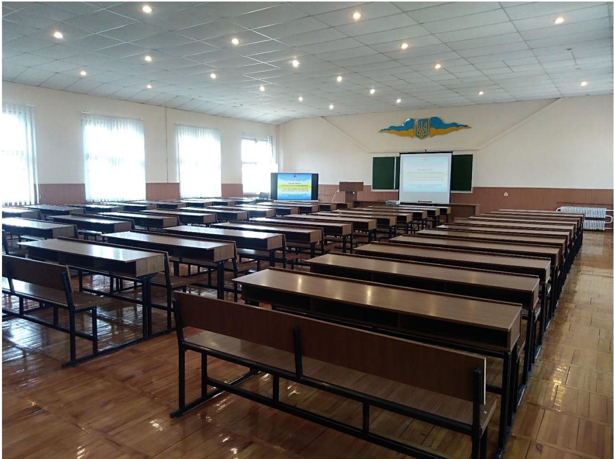
Лекційна аудиторія №500, розрахована на 140 місць, обладнана інтерактивним дисплеєм SMART MX275-V2 та комплектом комунікаційного обладнання